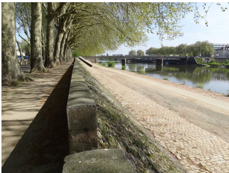
Figure 1 : Quai Monge

Le Quai Monge s'inscrit dans une dynamique plus globale de retour vers la rivière avec : la promenade Jean-Turc, l'esplanade Cœur de Maine et le tramway, les halles gourmandes et le Mail de la Poissonnerie.